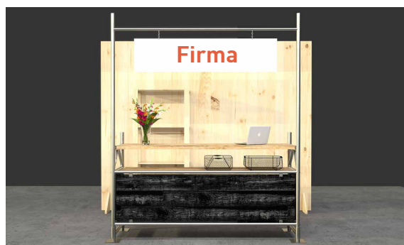
Standbeispiel – Dekoration ist nicht im Paket inkludiert.

Bitte senden Sie Ihr Logo als Datei (im eps-Format oder als druckfertiges jpg) an folgende E-Mail-Adresse: lisa.scheurer@messe-karlsruhe.de