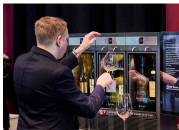
WINE EXPERIENCE Raritäten

Wir bestellen gemäß den Teilnahmebedingungen folgende Präsentationsleistung: