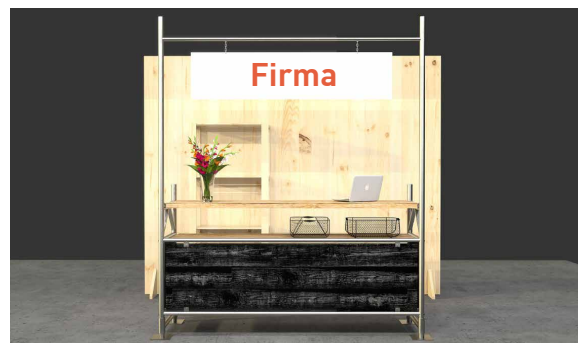
Standbeispiel – Dekoration ist nicht im Paket inkludiert.

Bitte senden Sie Ihr Logo als Datei (im eps-Format oder als druckfertiges jpg) an folgende E-Mail-Adresse: lisa.scheurer@messe-karlsruhe.de