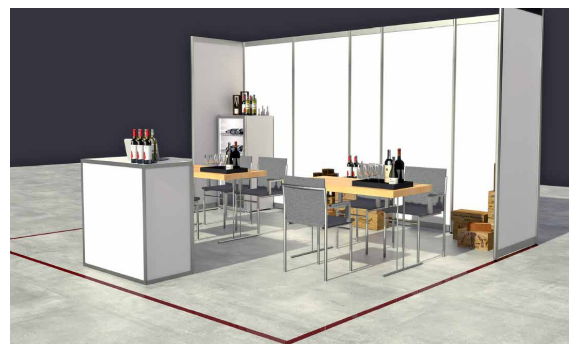
Standbeispiel – Kühlschrank und Dekoration sind nicht im Paket inkludiert.

Weitere Serviceleistungen (z.B. Teppich, Standbeleuchtung und -beschriftung, Kühlschrank) sind im OSC buchbar.