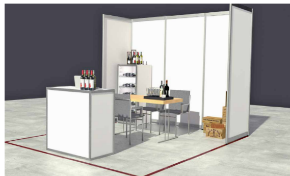
Standbeispiel – Kühlschrank und Dekoration sind nicht im Paket inkludiert.

Weitere Serviceleistungen (z.B. Teppich, Standbeleuchtung und -beschriftung, Kühlschrank) sind im OSC buchbar.